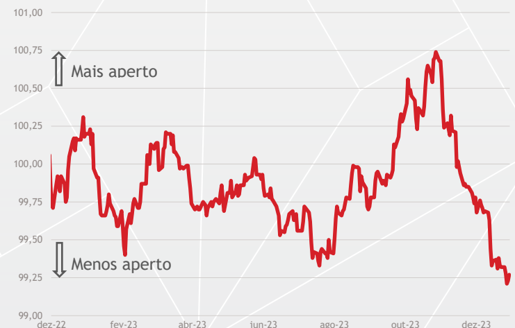
EUA: ÍNDICE DE CONDIÇÕES FINANCEIRAS