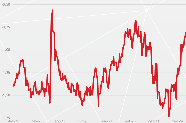
EUA: QUANTIDADE DE CORTES DE JUROS PRECIFICADOS PELO MERCADO NO ANO DE 2024

No Brasil, o Congresso retomou os trabalhos em um ano com o calendário apertado por conta das eleições